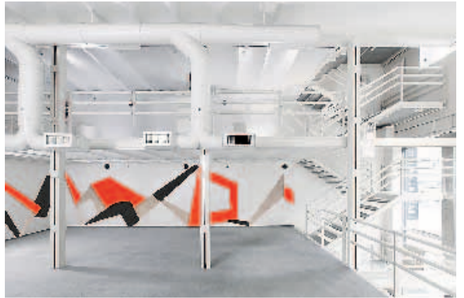
El encuentro de la pintura mural de Inés Raiteri con la arquitectura moderna de Praxis no es un hecho casual: se trata de un site specific, una obra creada especialmente para intervenir artísticamente los espacios de la galería.

Frente a la ausencia de líneas curvas, las tensiones generadas por las severas líneas rectas y las diagonales, exaltan la redondez de los tubos de aire a la vista, y la de los pasamanos circulares de las escaleras. En medio de las líneas puras de la galería, las formas onduladas de bovedilla y el rigor de las columnas de hierro procedentes de la arquitectura original, configuran un edificio que coincide con el bello eclecticismo porteño que reina en la zona de Arenales y Talcahuano. Si la arquitectura es «música sólida», como decía Valery , si a pesar de su densidad, comparte las mismas consonancias, disonancias y ritmos, entre otras cualidades, este mural aspira a sensibilizar el ojo del espectador, para percibir la belleza del mundo a través del devenir de las formas. A la idea de una arquitectura pétreo se contraponen las pinturas de una serie de módulos cuyas va-